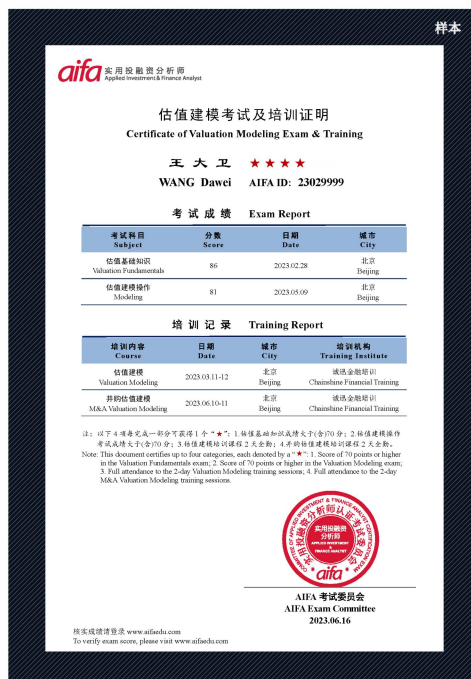
估值建模考试及培训证明